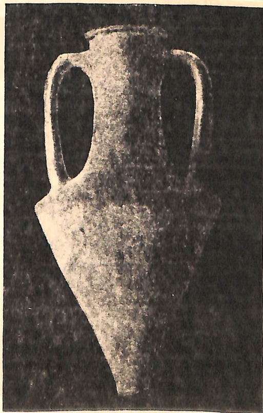
Рис. 9. Херсонесская амфора № 1332 с клеймом астинома, найденная в г. Керчи