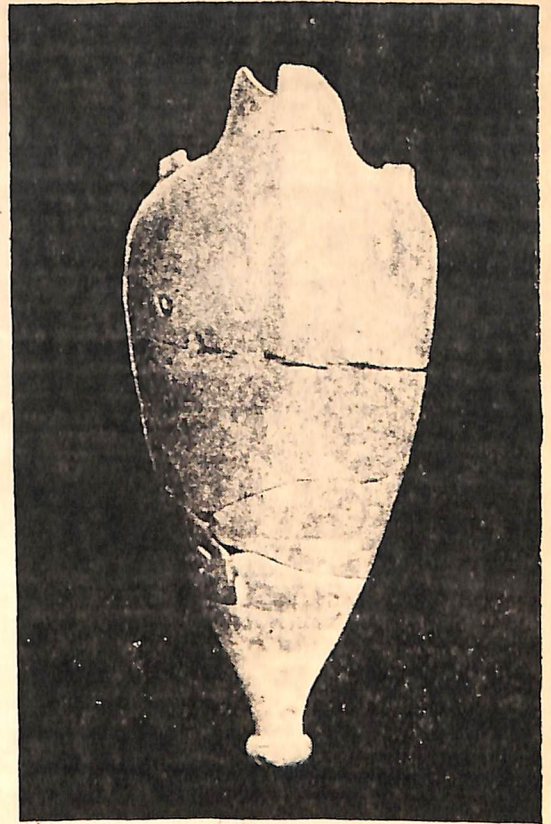
4. Остродонная амфора, найденная при раскопках Херсонеса

(p. 162) End IV or not later beginning 3 rd c. Chersonesia