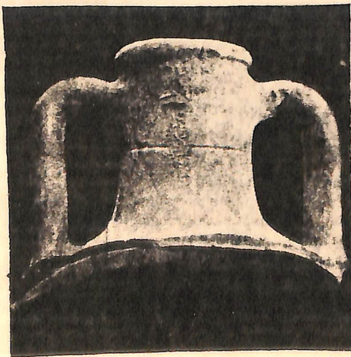
Рис. 3. Херсонесская амфора, найденная при раскопках Зеленого кургана с клеймом на горле

2 nd half 3 rd to the beginning 2 nd c. B.C. (p. 166)