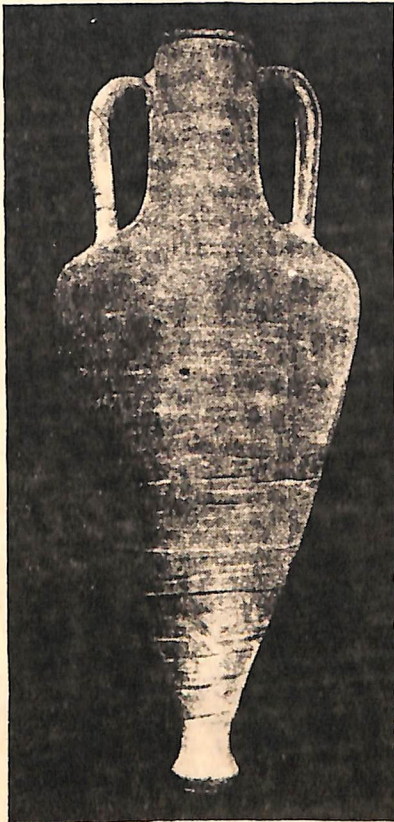
Рис. 2. Остродонная амфора, № 3192, найденная при раскопках Херсонеса