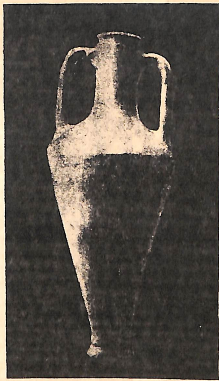
Рис. 7. Остродонная амфора № 3285, найденная при раскопках Херсонеса.