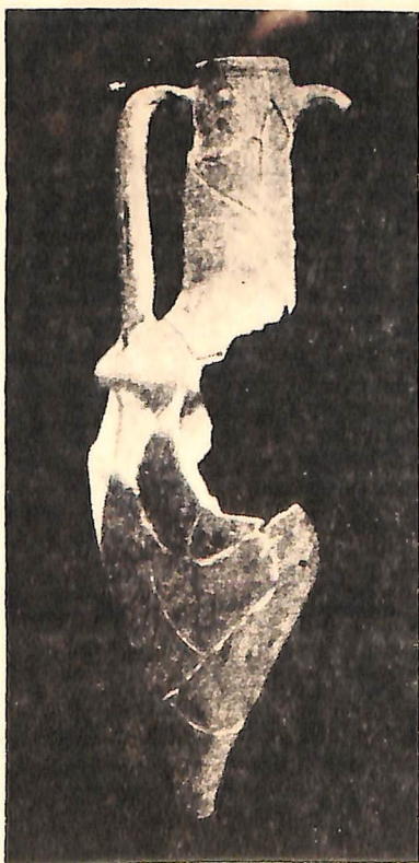
Рис. 8. Остродонная амфора, найденная при раскопках некрополя Херсонеса в 1937 г.