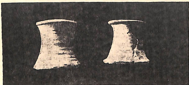
Рис. 10 Подставки для остродонных амфор, найденные при раскопках Херсонеса