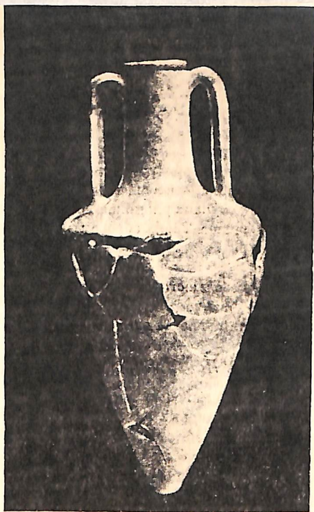
Рис. 6. Остродонная амфора (6/39 1937 г.), найденная при раскопках некрополя Херсонеса в 1937 г.